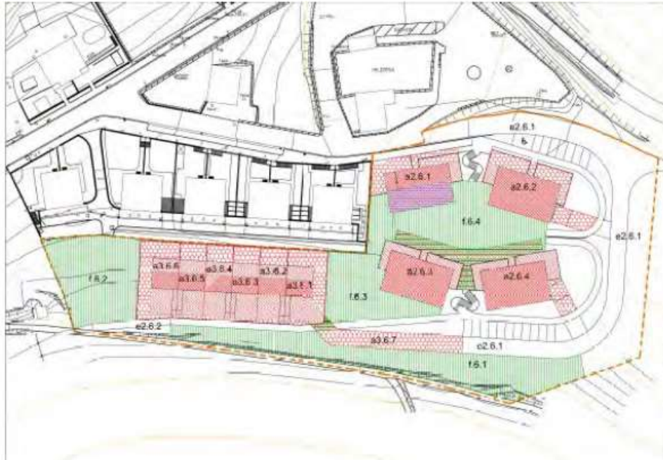
Imagen 1: Ordenación pormenorizada del nuevo suelo urbanizable "Sector 6 "

El Plan no prevé nuevos ámbitos urbanísticos para actividades económicas, ni industriales ni terciarios.