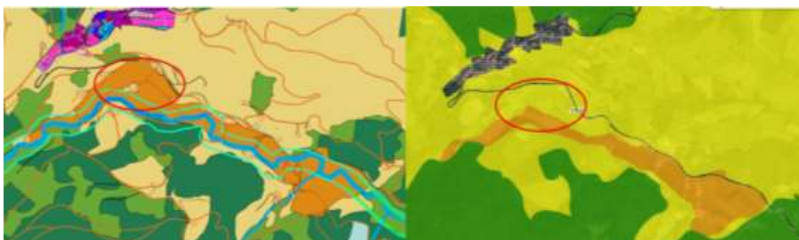
Imagen 3: Categoría agroganadera y campiña, en naranja, en el entorno de Bengoetxea-Beltxalaga. Izda ordenación del PGOU. Dcha, ordenación del PTS.

El PGOU de Alkiza plantea una delimitación de la categoría Agroganadera y campiña de Alto Valor Estratégico que difiere de la recogida en el PTS Agroforestal, sobre todo en el entorno de Bengoetxea-Beltxalaga y de Arizmendi.